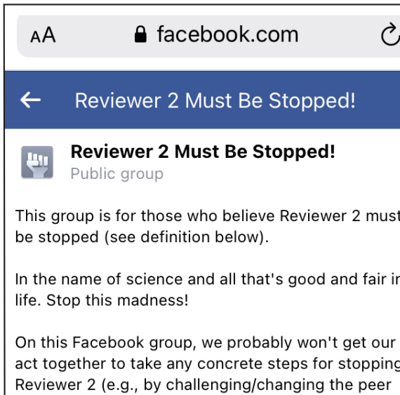
Kuva 2. ”Vertaisarvioija 2:n pysäyttämiseksi” perustetun satiirisen Facebook-ryhmän Tietoja-sisältöesittely. Lähde: kuvakaappaus ryhmästä, https://www.facebook.com/groups/71041660468 .