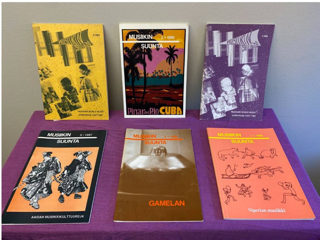
Kuva 1: Musiikin suunnan teemanumeroita 1986–90.

Musiikin suunnan ja Etnomusikologian vuosikirjan artikkeleitakin on usein käytetty opetusmateriaalina, jotta opiskelijoille on voitu tarjota suomenkielistä ja suomalaiseseen kontekstiin paremmin sopivaa luettavaa alan keskeisten, enimmäkseen englanninkielisten teosten rinnalla. Tietyn maan tai alueen musiikkeihin