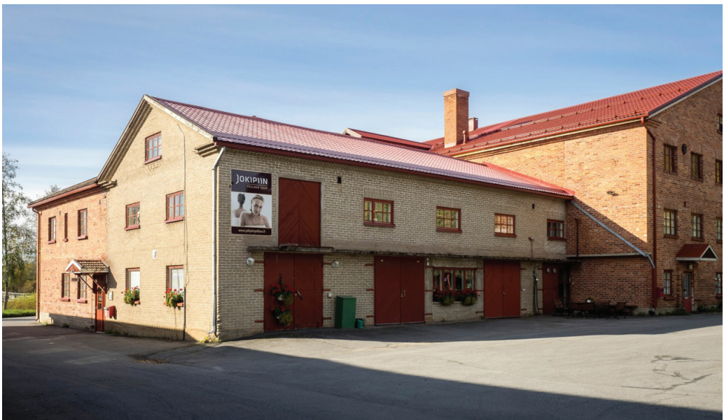
Kuva 4. Jokipiin Pellavan tehdasrakennus Jalasjärvellä.

Jalasjärvellä, Jokipiin pellavatehtaalla (ks. kuvat 4 ja 5) järjestetyn illallistahtuman teemana oli ”Pellavatehtaalta puuvillapellolle”. Tarkoituksena oli muistuttaa kuulijoita Jalasjärven 1800–1900-lukujen vaihteen historiasta, jolloin muuttoliike Etelä-Pohjanmaalta Pohjois-Amerikkaan oli vahvimmillaan. Teemaa korostettiin kahden erilaisen musiikkityylin, eteläpohjalaisen kansanmusiikin ja amerikkalaisen bluesin avulla. Tavoitteena oli kertoa haasteellisista ja ristiriitaisista olosuhteista, joissa ihmiset elivät samaan aikaan eri puolilla maailmaa. (Silén 2015.)