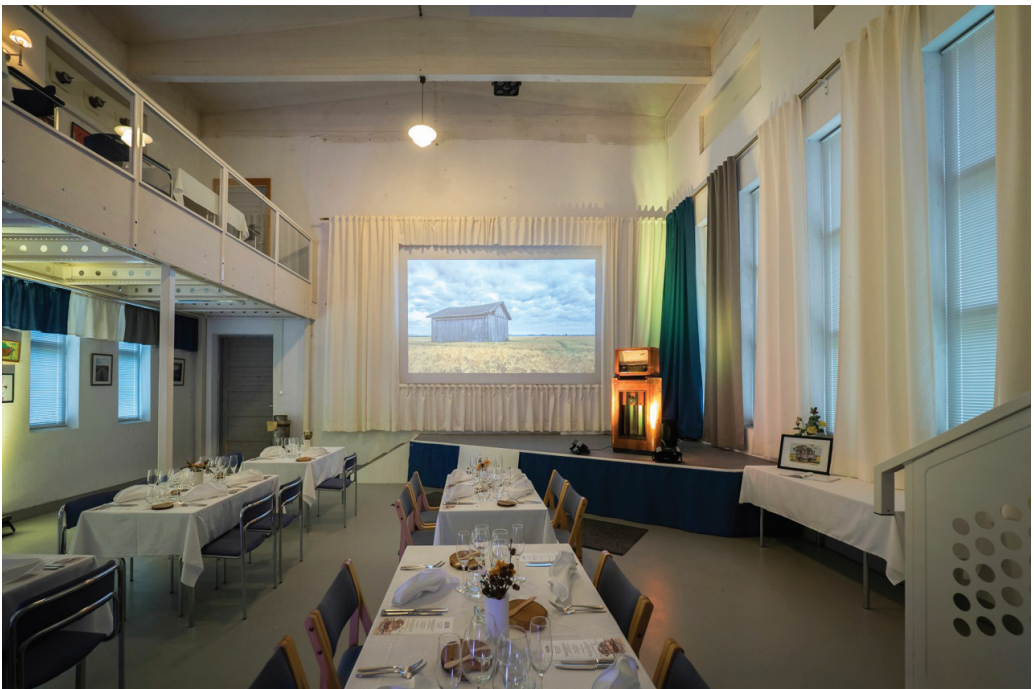
Kuva 3. Jyllinkosken sähkölaitosmuseoon toteutettu ravintolasali.