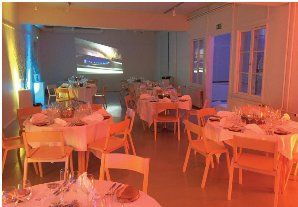
Kuva 7. Taidekeskus Harriin toteutettu ravintolasali.