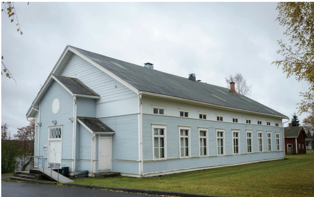
Kuva 6. Taidekeskus Harri Alavudella.