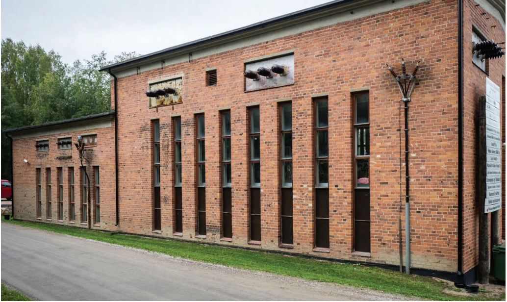
Kuva 2. Jyllinkosken sähkölaitosmuseo Kurikassa.