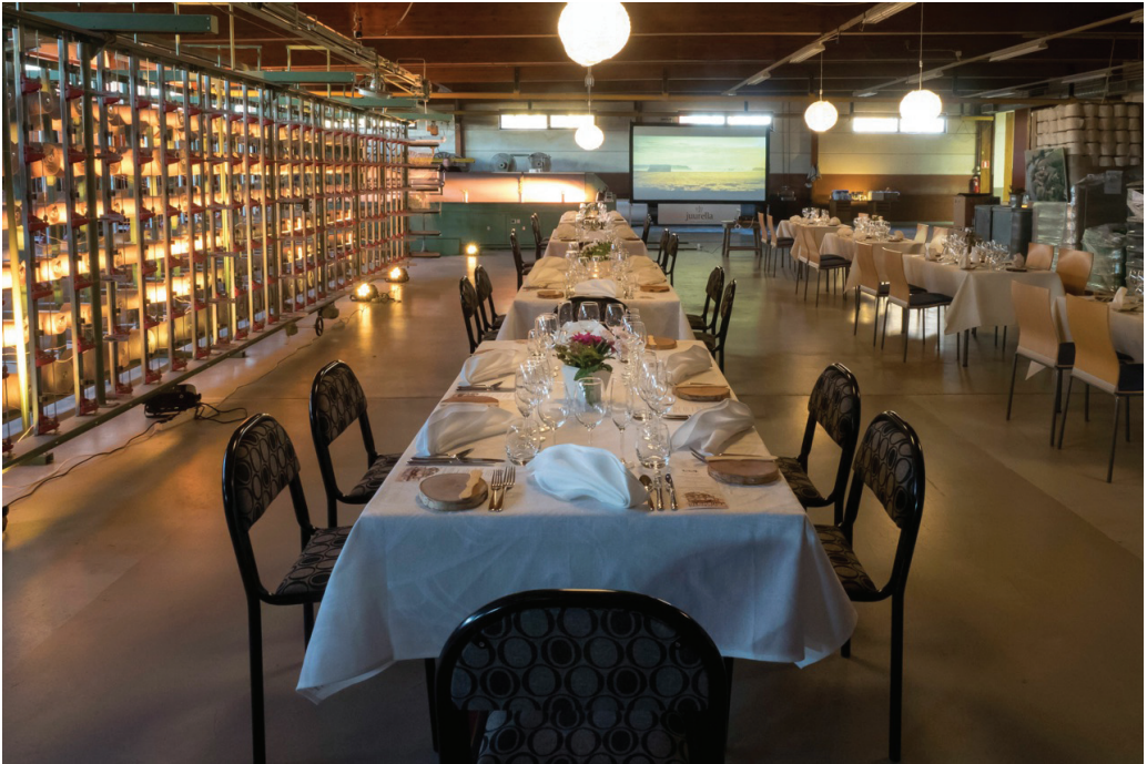
Kuva 5. Jokipiin Pellavan tehdasrakennukseen toteutettu ravintolasali.

Molemmissa musiikkityyleissä on kyse Silénin näkemyksen mukaan yksinkertaisesti esitetystä ja "tavallisen kansan keskuudessa syntyneestä" musiikista. Eri kappaleiden aiheet muistuttivat toisiaan: laulettiin työstä, rakkaudesta, onnesta ja vastoinkäymisistä.